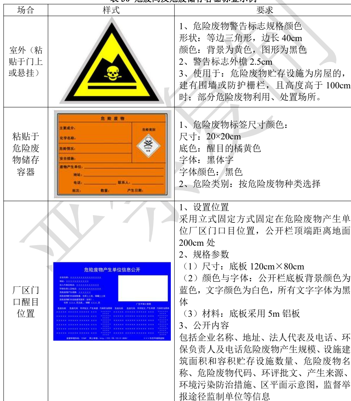
表 30 危废间及危废储存容器标签示例

本项目产生的固废处理处置时本着尽量减少废物排放、优先考虑综合利用的原则，对其进行综合利用。在采取上述分类收集、分类处理处置的措施后，本项目产生的固体废物不会对周围环境造成不良影响。