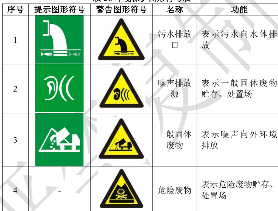
表 36 环境保护图形符号表

因此,本项目应按照《环境保护图形--排放口(源)》(GB15562.1-1995)等的技术要求,设置相应的环境保护图形标志,环境保护图形符号见下表。