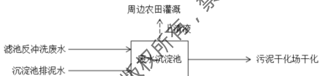
图4 项目废水处理工艺流程图