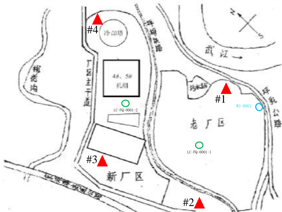
图4 厂区平面布置图