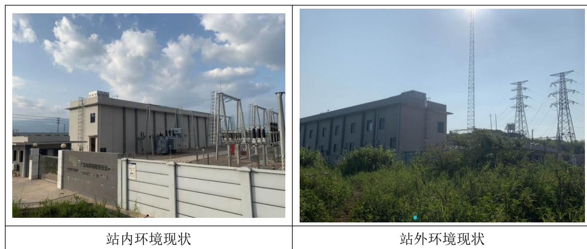
图 3.1-2 项目生态环境现状照片

本工程不涉及《建设项目环境影响评价分类管理名录（2021 年版）》中的第（一）类环境敏感区，即不涉及国家公园、自然保护区、风景名胜区、世界文化和自然遗产地、海洋特别保护区和饮用水水源保护区，不涉及重要保护湿地。