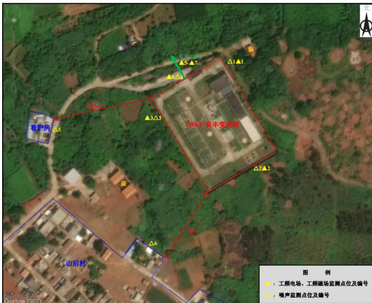
图 1 湛江 110kV 良丰变电站类比监测布点图