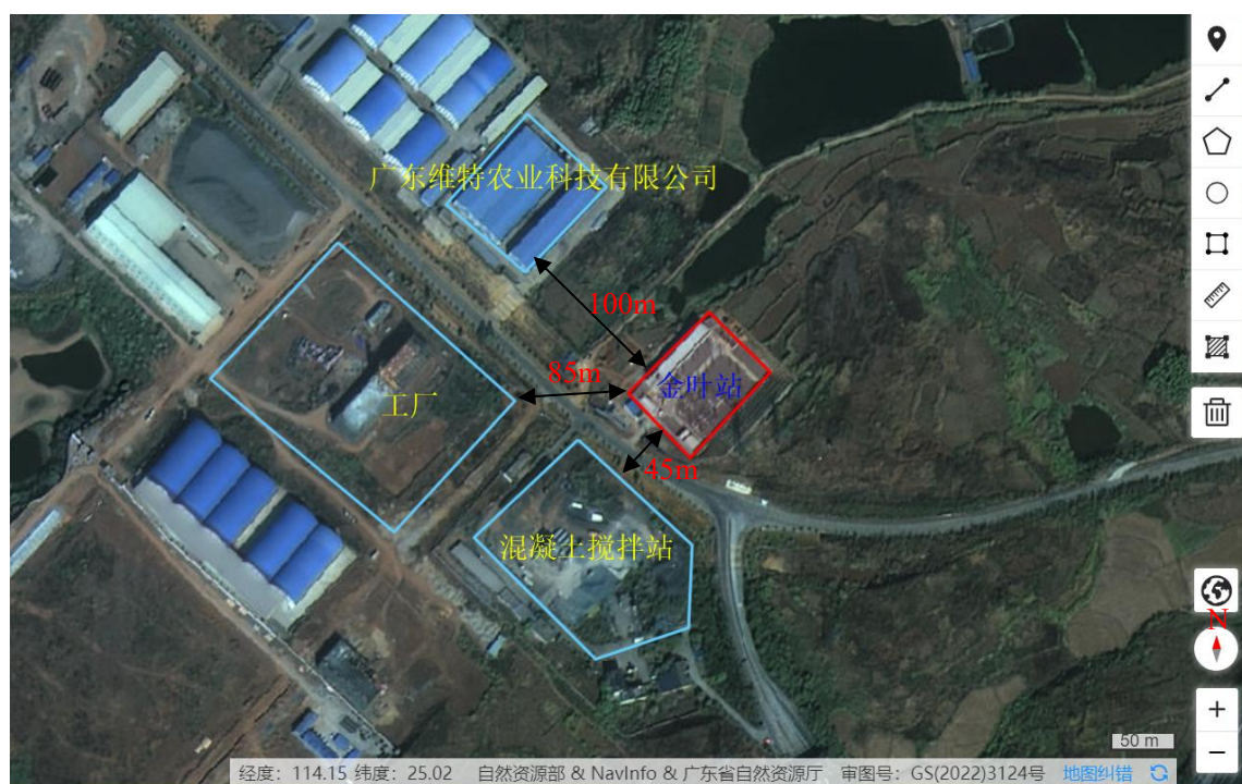
图 3.1-1 金叶变电站四至图

根据现场调查，项目不涉及生态敏感区域、生态保护红线，站址周边植被主要为杂木及杂草，无珍稀濒危动植物，未发现明显的水土流失等问题，区域生态环境质量现状良好。变电站现状照片见下图3.1-2。