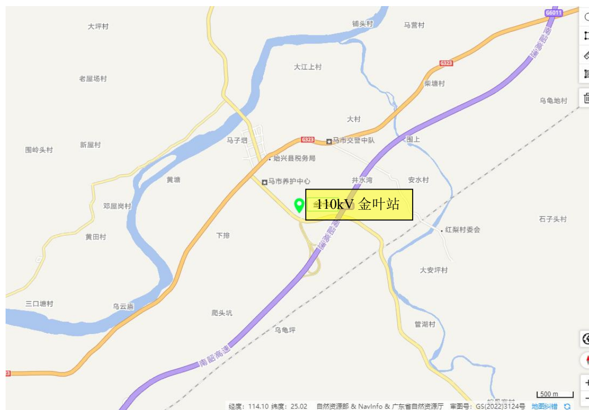
2.1-1 110kV 金叶变电站地理位置图