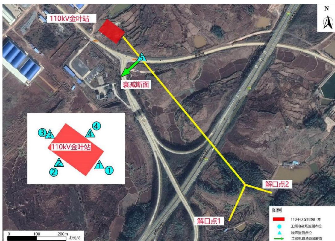
图 3.2-1 环境现状检测布点图

验收检测时在厂界四周分别布设 4 个厂界噪声和电磁检测点, 布点图见图 3.2-1。